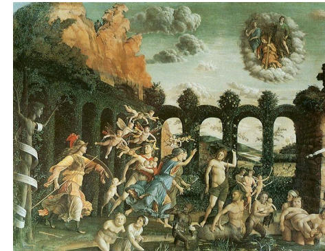
Andrea Mantegna "Il trionfo della virtù"

Evento di eccellenza del Ministero dell'Istruzione riconosciuto ai sensi del DM 655/2020